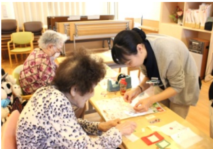
▲細かい作業に苦戦しつつ…出来上がりにわくわくします！

十一月十五日、すいせ んクラブを開催しました。 久しぶりの開催に、参加 者の皆様も心待ちにして いたご様子！今回はお正 月に向けて「和紙のア ートトリウム」を作りました。 あでやかな色の和紙や