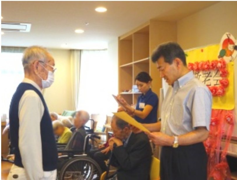
▲施設長より慶祝状を受け取るN様。

九月十七日の敬老の日 に先立ってラッパーズ太田では十四日に敬老会を行ないました。施設長の祝辞の後に米寿（八十八歳）の方、卒寿（九十歳）の方、白寿（九十九歳）の方に慶祝状が贈られました。敬老会を通じてみなさんと楽しい時間を共有できたことに感謝し、これからも健康に気を付けてお元気に過ごしていただきたいと思えます。また来年も皆さんと一緒に祝いできることを願っています。