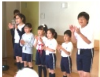
▲歌もゲームも盛り上がりました

いました。元気な子供たの姿に入居者の皆さんの表情は笑顔にあふれ、涙を流す方も・・・。帰り際には握手で別れを惜しんでしました。また来て下さるのを楽しみにしています！