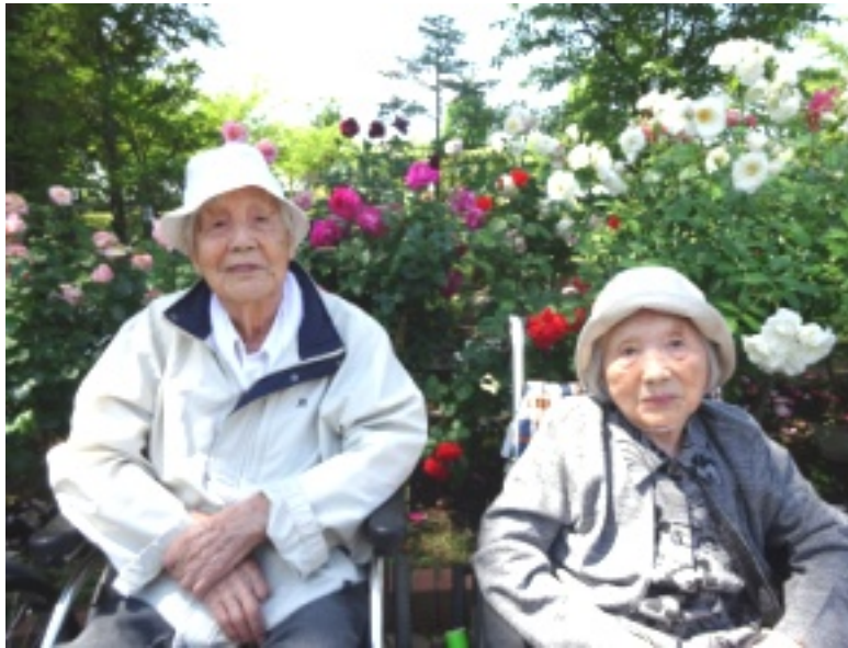
▲お天気にも恵まれ、素敵な写真を撮ることができました♪

今年も楽しみにしていた妻沼の道の駅にあるアグリパークのバラが満開になりました。赤や白・黄色など色鮮やかで、小さなものから大きなものまでたくさんの種類のバラを鑑賞しました。 園の中はバラの香りが心地よく職員も入居者の皆様も癒されました。バラの前での記念撮影は、ちょっと照れたりおどけてみたり、みなさん楽しい一日を過ごすことができました。