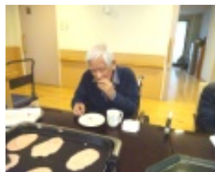
▲できたては最高です！！