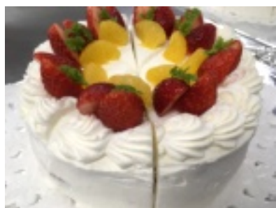
▲ひとつひとつ丁寧に作っています。

のある色とりどりのフルーツをはさんで、いちごを乗せて出来上がり。いくらでも食べられそうな美味しさです。