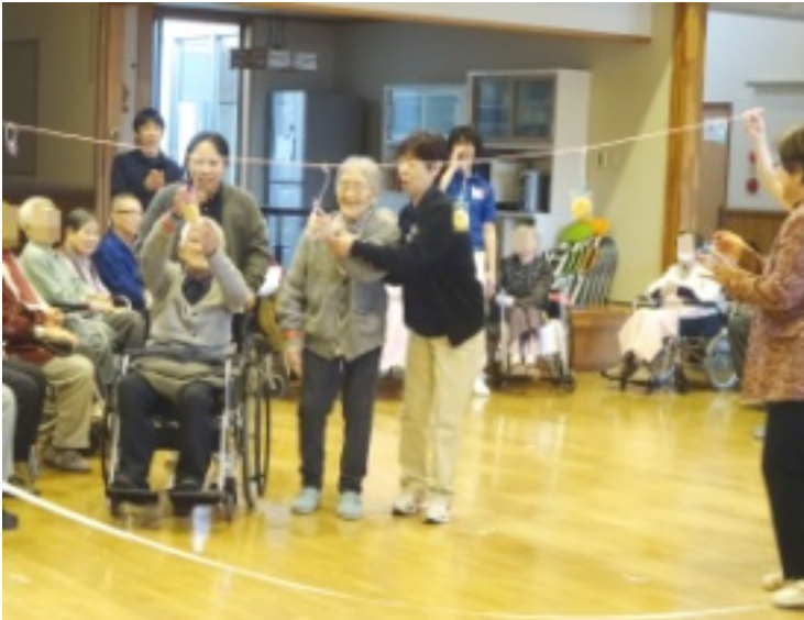
▲みんなの声援をうけて頑張ります！