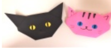
▲プレゼントは可愛いネコの折り紙♪