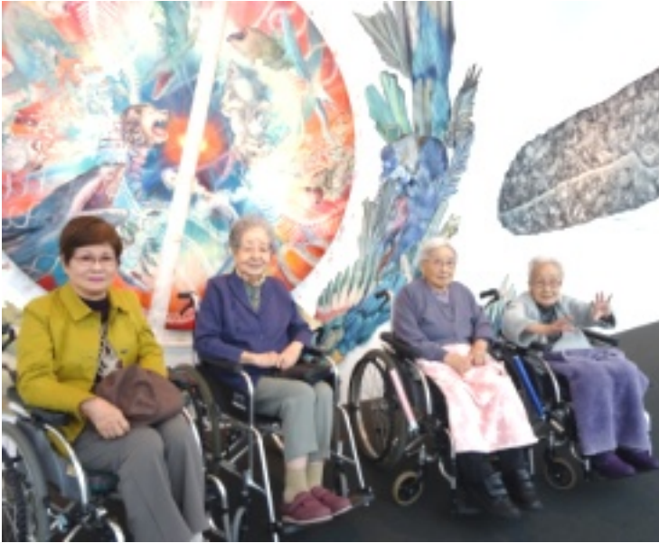
▲ダイナミックな作品をバックに記念の一枚！

すっかり肌寒くなり、秋を感じるようになった十月。秋と言えば芸術の秋という事で、今年オーブンしたばかりの太田市美術館・図書館へ行ってきました。 駐車場に着いた瞬間から「駅前にこんな建物があったのね！」と皆様ワクワクされている様子。館内は、絵本の原画や油絵などが展示してあり、通路には壁一面を使った大作も。とても真剣な表情で鑑賞されていました。 ハロウィンイベントも行なわれており、「トリックオアトリート」の合言葉でプレゼントを持ち帰る方もいらっしゃいました。 芸術に触れることで、皆様の生活への良い刺激となったのではないのでしょうか！