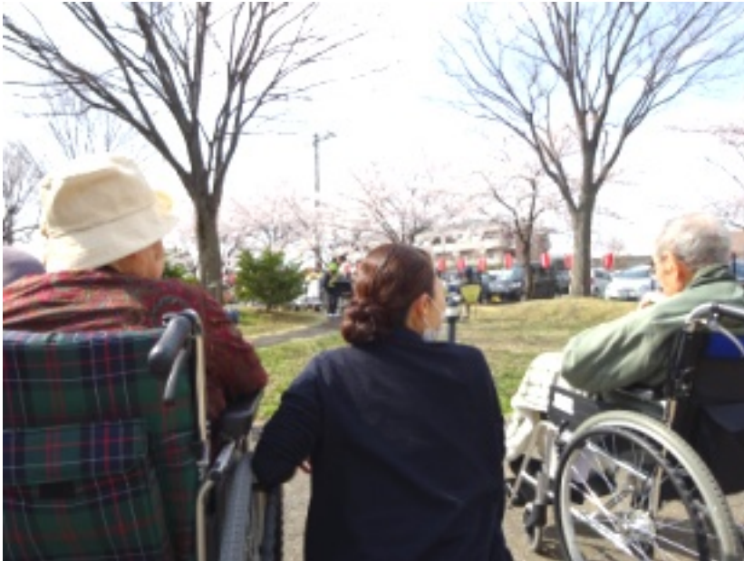
▲桜は満開！綺麗に咲きました。皆様と春を実感！