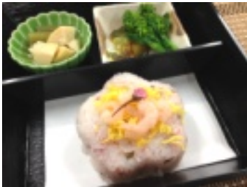
▲フキ・筍・菜の花…春の味です

は年に一度だけ味わえる一品です。桜風味のちらし寿司を花型で抜いたお寿司は、見た目も味も春爛漫です。そしておやつは「桜のねりきり」。飲み込む事が難しい方には、こちらをゼリーに加工します。食