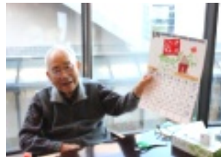
▲1月カレンダーの完成！