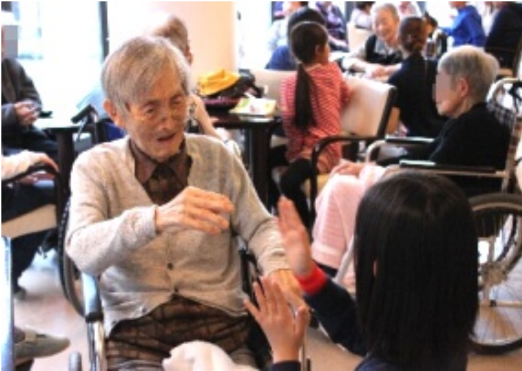
▲昔から変わらぬ手遊びで楽しいひととき・・・。