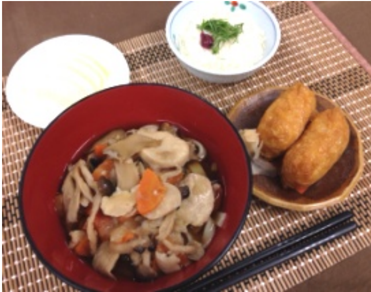
▲「おっきりこみ」は変わらない母の味・・・。

やつには群馬県民のソウルフード「焼きまんじゅう」です。このあたりは農作物が豊富で特に小麦が良く作られていたらしく、昔から夕食はうどんというご家庭も多かったそうです。「おっきりこみ」も働き者の女性が、