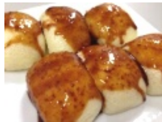
▲甘辛のたれがやみつきに！