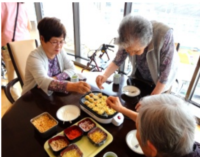
▲フロア中に漂う美味しい香り…

6月の8日・15日・22日水曜日のおやつ時間に、たこ焼き作りを行いました。お好み焼き・たこ焼きなどの「こなもん」は皆さんに大人気！初めはなかなか遠慮をして手を出せなかった方も、 段々丸く焼けていくたこ焼きの様子を見て、積極的に竹串を持って参加していただけました。焼きたてアツアツを「ふーっ」としながら食べる、手作りならではの美味しさです。