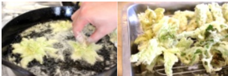
▲ふきのとうが花型に開きます！ ▲プロの技！サクサクです。