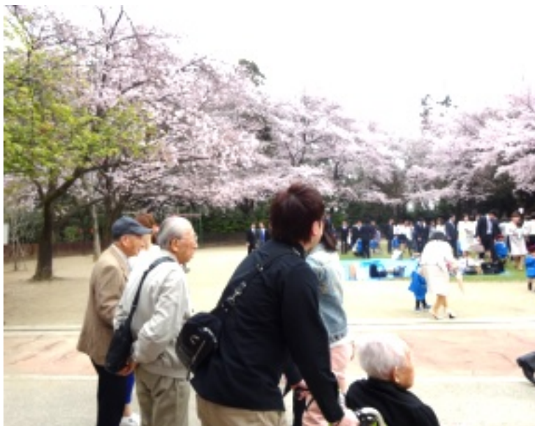
▲ちょうどこの日は幼稚園の入園式。可愛い子供達に癒されます♪

前年に続き、冠稲荷神社へお参りも兼ねて、お花見に出掛けました。日ごとに暖かくなり、春の訪れを感じるようになりましたね。入居者様も桜の開花をとて楽しんでみられていました。