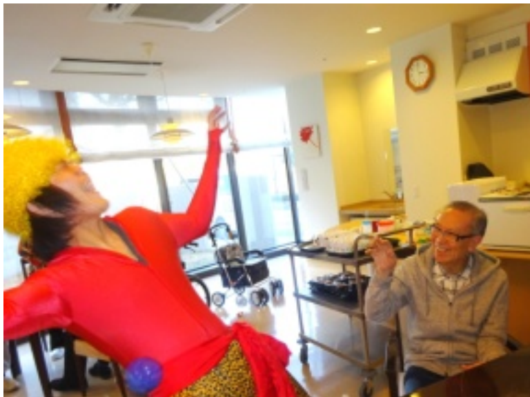
▲笑顔はじける節分会となりました♪鬼も体を張っています！

毎年恒例になっており、まず節分会、今年も2月3日に開催いたしました。ポールを手に待ち構える入居者様。鬼が登場すると、いっせいにポールを投げつけました。「鬼は外、福は内」の掛け声は外、福は内」の掛け声 も忘れ、豆まきを楽しみました。赤鬼・青鬼も元気いっぱい逃げ回ります。豆まきが終わった後には、鬼たちと笑顔で記念撮影。大いに盛り上がった節分会、今年も皆様に福がたくさん訪れますようお願い