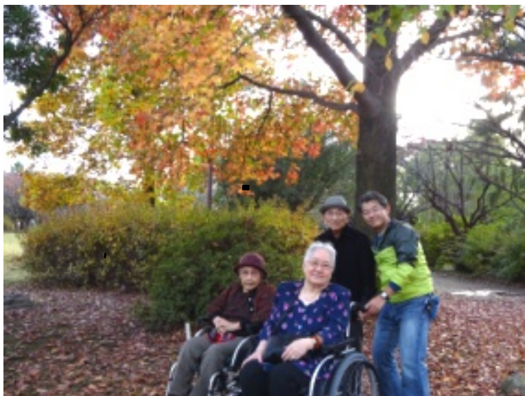
▲ 鮮やかな紅葉にうっとりしてしまいますね☆